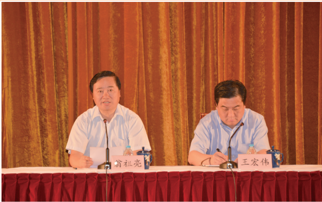
▲ 6月18日，闸北区委书记翁祖亮向离退休干部通报区情。