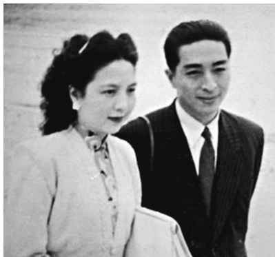
陈歌辛与夫人金娇丽