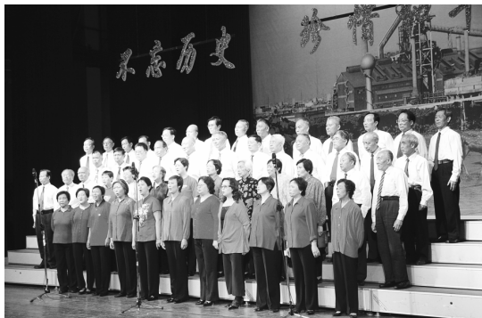
加歌咏比赛 退休支部与非党处 级干部合建歌队参