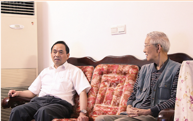
▼ 近日，黄浦区召开“忠诚铸就梦想”——庆祝上海解放65周年暨老干部“双先”表彰活动。